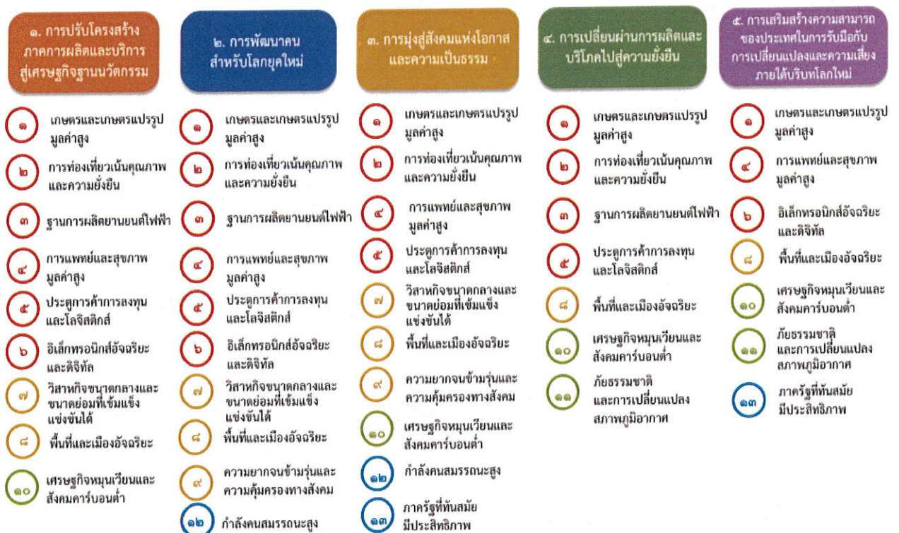
แผนภาพที่ ๓.๑ ความเชื่อมโยงระหว่างหมวดหมู่การพัฒนาที่เป้าหมายหลัก

ความเชื่อมโยงระหว่างหมวดหมู่การพัฒนาที่เป้าหมายหลักแสดงไว้ในแผนภาพที่ ๓.๑ โดยหมวดหมู่การพัฒนาที่กำหนดขึ้นเป็นประเด็นที่มีลักษณะเชิงบูรณาการที่ครอบคลุมการพัฒนาตั้งแต่ใน ระดับต้นน้ำจนถึงปลายน้ำ และสามารถนำไปสู่ผลพัฒนาทั้งในมิติเศรษฐกิจ สังคม ทรัพยากรธรรมชาติและ สิ่งแวดล้อมไปพร้อมๆ กัน ทำให้หมวดหมู่แต่ละประการสามารถสนับสนุนเป้าหมายหลักได้มากกว่าหนึ่งข้อ นอกจากนี้การพัฒนาภายใต้แต่ละหมวดหมู่ไม่ได้แยกขาดจากกัน แต่มีการสนับสนุนหรือเอื้อประโยชน์ซึ่ง กันและกัน