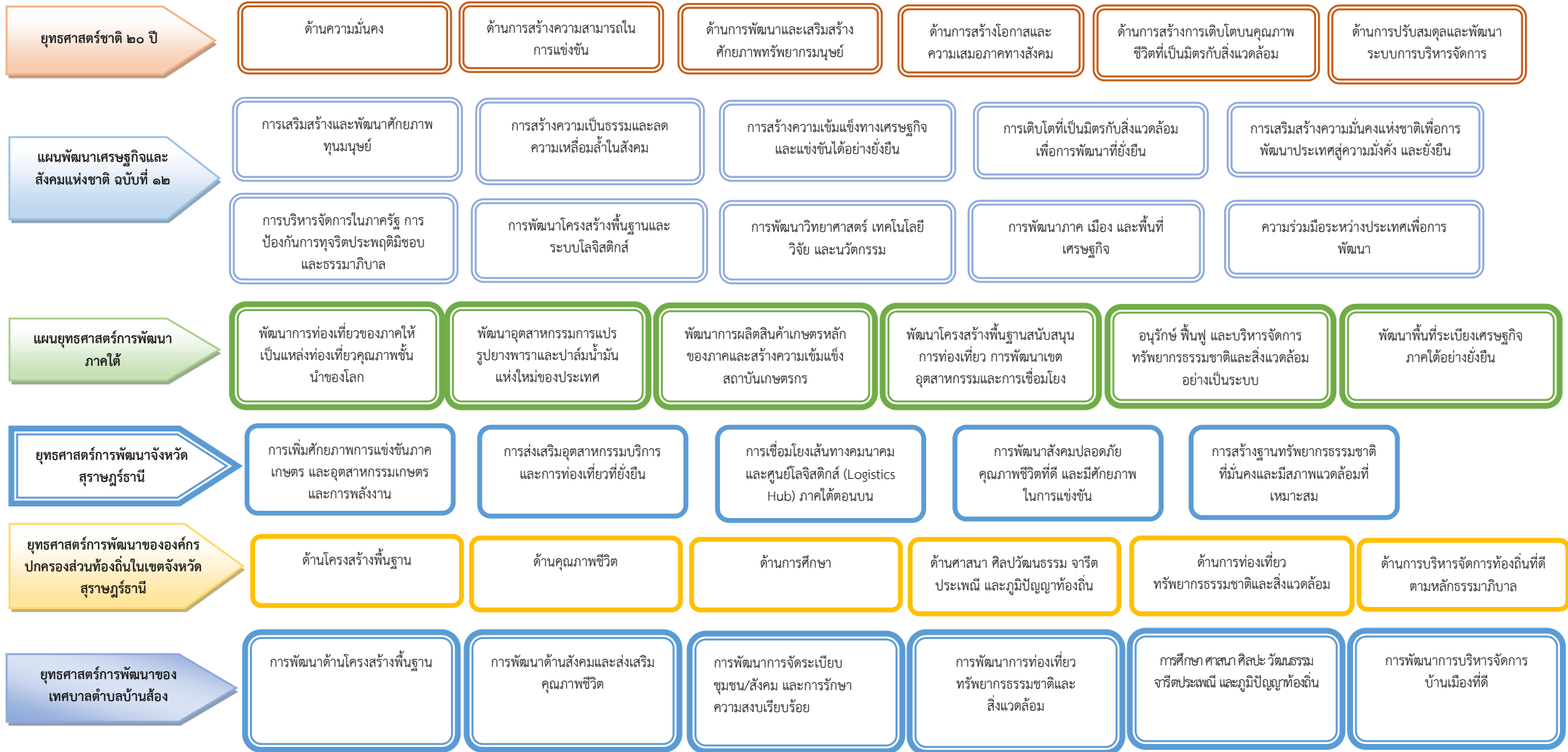
แผนพัฒนาท้องถิ่น (พ.ศ. ๒๕๖๖ - ๒๕๗๐) โดยเทศบาลตำบลบ้านลือ อำเภอเวียงสระ จังหวัดสุราษฎร์ธานี